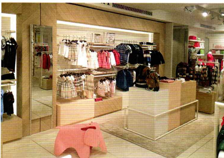
ΚΑΤΑΣΤΗΜΑ ΣΤΟ ΑΤΤΙΚΑ, 2017. © TSQUAREARCHITECTS

Κ Πόσο ενεργά επεμβαίνουν οι ιδιοκτήτες στο τελικό αποτέλεσμα; Ποιος είναι ο ιδανικός πελάτης;