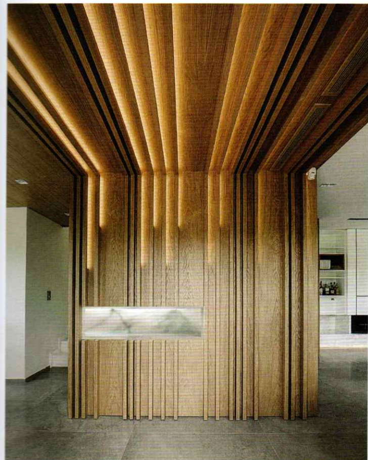
ΚΑΤΟΙΚΙΑ "WOODWORK HOUSE" ΣΤΟΥΣ ΕΛΑΙΩΝΕΣ, 2016.