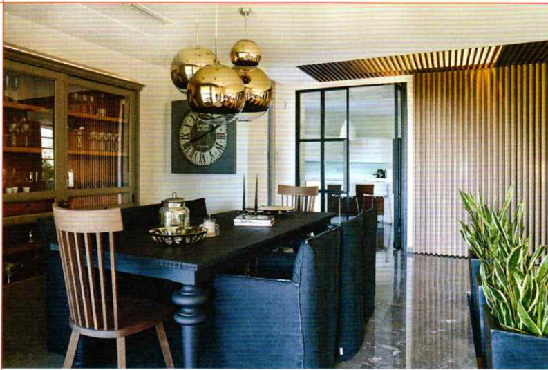
"BARCODE HOUSE" ΜΟΝΟΚΑΤΟΙΚΙΑ ΣΤΟ ΠΑΝΟΡΑΜΑ, 2010. © ΙΩΑΝΝΑ ΡΟΥΦΟΠΟΥΛΟΥ