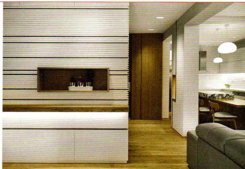
ΔΙΑΜΕΡΙΣΜΑ "NEU HOUSE" ΣΤΗΝ ΚΑΛΑΜΑΡΙΑ, 2016.