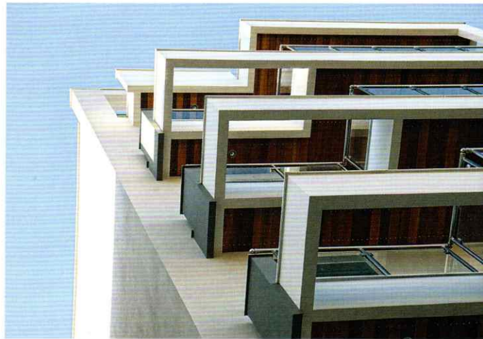
ΠΟΛΥΚΑΤΟΙΚΙΑ ΣΤΗΝ ΚΑΛΑΜΑΡΙΑ, 2011.