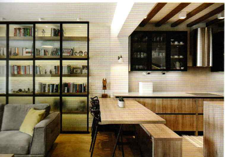
"URBAN COUNTRY HOUSE" ΜΟΝΟΚΑΤΟΙΚΙΑ ΣΤΗ ΘΕΡΜΗ, 2017. © NIKOS VAVDINOUDIS - CHRISTOS DIMITRIOU / STUDIOVD.GR