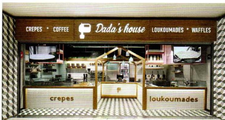
DADA'S HOUSE, 2017.