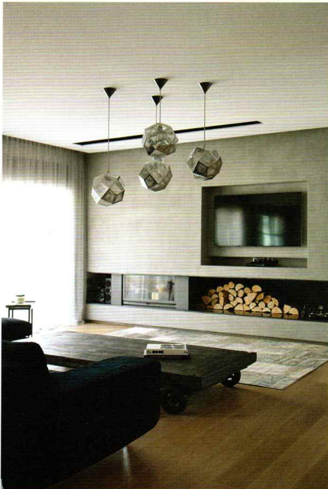
"GRAYSCALE" ΔΙΑΜΕΡΙΣΜΑ ΣΤΗ ΝΕΑ ΠΑΡΑΛΙΑ ΘΕΣΣΑΛΟΝΙΚΗΣ, 2014.