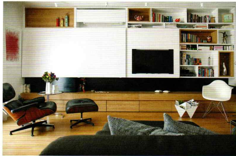
"EL APARTMENT" ΔΙΑΜΕΡΙΣΜΑ ΣΤΗΝ ΚΑΛΑΜΑΡΙΑ, 2015. © ΙΩΑΝΝΑ ΡΟΥΦΟΠΟΥΛΟΥ