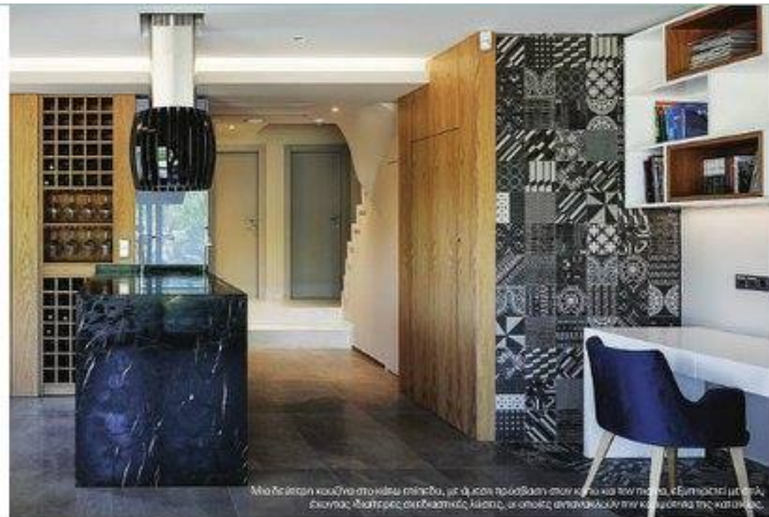
Μια δεξιά του καθιστικού στο κέντρο της αίθουσας, με άμεση πρόσβαση στον χώρο και τον κήπο. Εμπνευστεί με την Α. Σκηνής διατηρείς ορθολογική λύση, οι οποίες αναπαράγουν την κουλτούρα της κατασκευής.