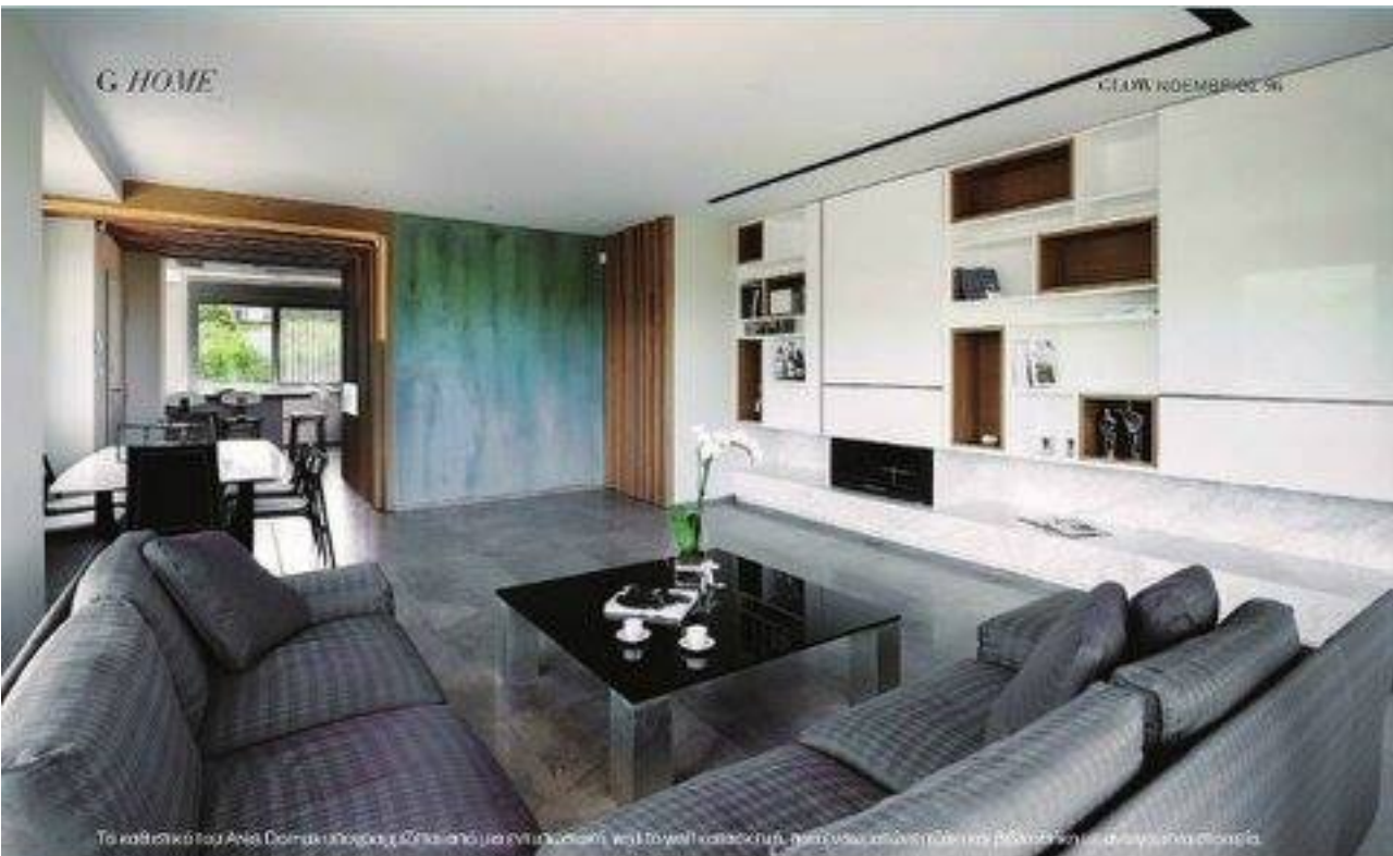
Το καθιστικό του Area Domus υπογραμμίζεται με εντυπωσιακή wall to wall κατασκευή, που αναδεικνύει τον βιολόγο και δημιουργό της σκηνής.